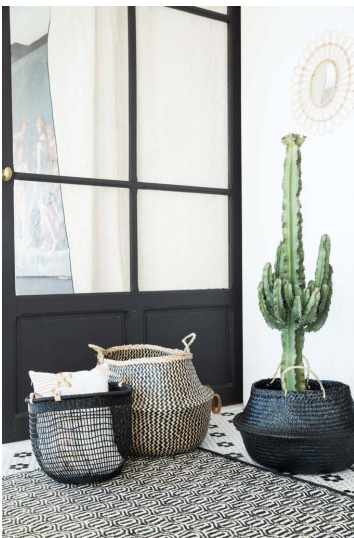
Paniers cache-pot – Cyrillus