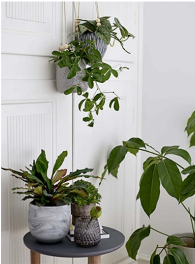
Plantes d'intérieur – Bloomingville

vont adoucir la pièce. Selon les goûts, les couleurs marron, verte et beige s'harmonisent avec une pièce en noir et blanc. Pour plus de gaieté et de fraîcheur, il est aussi conseillé de planter des végétaux à la fenêtre, ou de les disposer au sol pour obtenir un effet cocooning et pimper la déco. En effet le total look noir et blanc peut rapidement devenir terne et sombre s'il n'est pas accessoirisé.