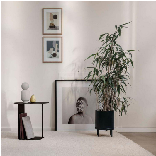
Sélection mobilier noir et blanc – Ferm Living

En outre, les peintures peuvent aussi être retouchées . D'ailleurs, la partie basse des murs doit être en noir pour améliorer le coin chambre en un nid douillet. Si la surface de la chambre est grande, il est conseillé de peindre les murs en noir mat. En même temps, il faut prévoir une literie claire pour éviter que la chambre soit sombre. En tant qu'objet de décoration, une branche d'arbre peinte en blanc va éclairer et offrir de la poésie à l'espace.