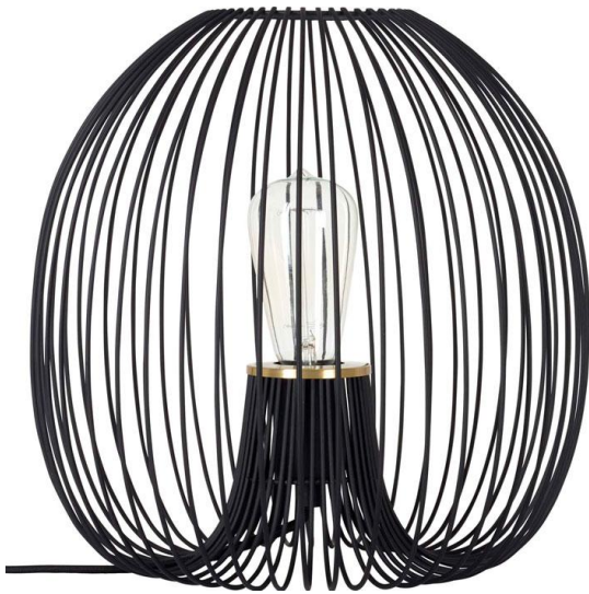
Lampe noire – Habitat Visuel indisponible

Suspendre une penderie garantit un espace égayé par des touches textiles. Cette solution va rendre la pièce vivante et compléter l'ameublement de la chambre. Les vêtements noirs tranchent avec le mur peint en blanc. Quant au luminaire, la couleur noire de cet objet s'harmonise avec un mur blanc. Pour plus de précision, mieux vaut le suspendre à une faible hauteur du lit afin de s'accorder au blanc du mur. De plus, la multiplication des luminaires rendra la chambre plus chaleureuse. Ainsi des lampes à abat-jour noir ou blanc viendront compléter la déco.