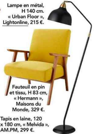
Fauteuil en pin et tissu, H 83 cm, « Hermann », Maisons du Monde, 329 €.