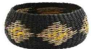
En corde, Ø 23 cm, Madam Stoltz, 41,50 €.