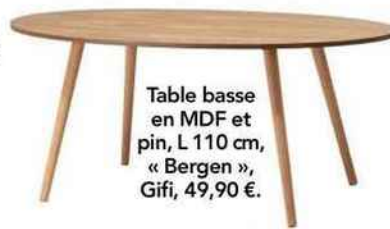
Table basse en MDF et pin, L 110 cm, « Bergen », Gifi, 49,90 €.