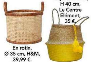
En jonc de mer, H 40 cm, Le Centre Élément, 35 €.

Utilitaires avant tout, ils sont devenus de véritables objets déco que l'on décline et laisse en vue. Pour tout ranger avec style : foulards, magazines ou jouets d'enfants.