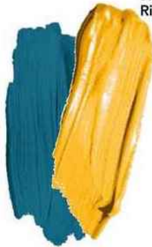
Marine Blue, Little Greene

L'association d'un bleu canard et d'un jaune d'or fonctionne à coup sûr, car ces deux teintes s'équilibrent. Plus le jaune domine, plus l'ambiance est solaire.