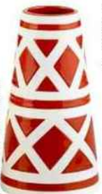
Vase en porcelaine, H 18 cm, « Omani », Conforama, 14,99 €.

Triangles, rayures, losanges : ces motifs géométriques dynamisent la déco. En petites touches sur les vases, textiles, tapis... ils donnent le ton de la pièce !