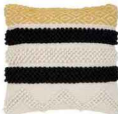
Housse de coussin en coton, 45 x 45 cm, « Takala », WestwingNow, 34 €.