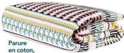
Parure en coton, « Orlan », Habitat, 89 €.