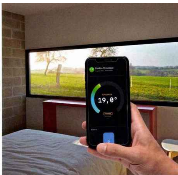
REALISATION ERIC LENOIR ARCHITECTE

FENÊTRE 2.0. Présentée lors de la dernière édition de Batimat, cette fenêtre climatique connectée permet non seulement de réchauffer ou de rafraîchir la température d'une pièce, mais aussi de contrôler et d'agir à distance sur la qualité de son air intérieur grâce à un mode purificateur. Climal with Netatmo , bientôt disponible. Technal.