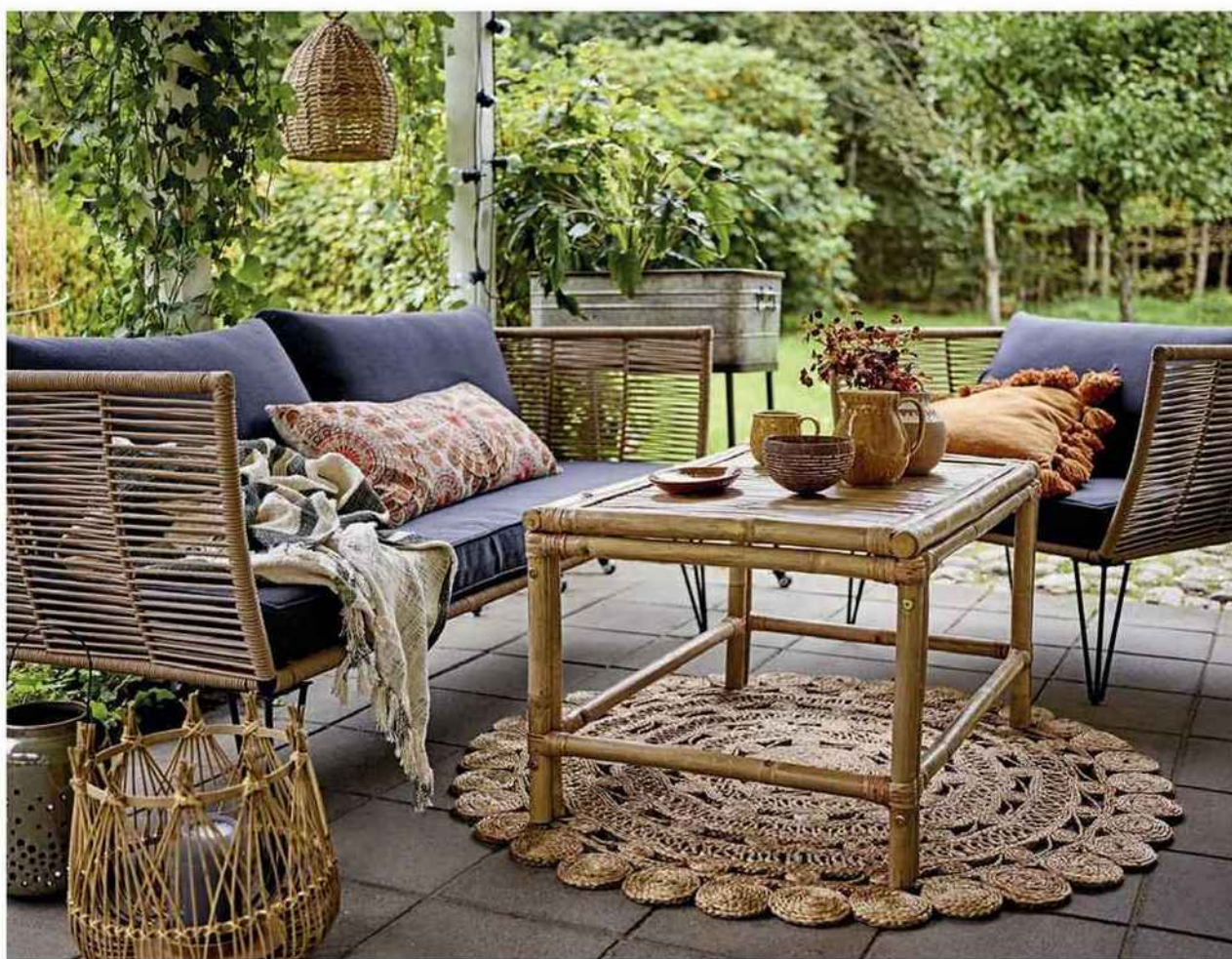
Sweetpea &amp; Willow