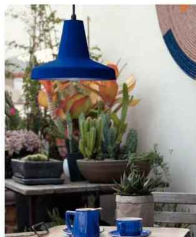
Made In Design